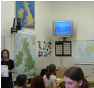
výuka v jazykové učebně