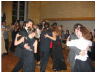
plný taneční parket