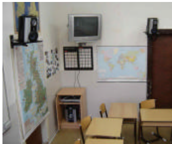
audiovizuální vybavení jazykové učebny