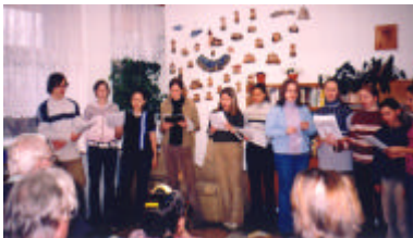
vystoupení v Domove pro seniory