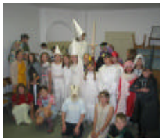
G 1 - Svojanov