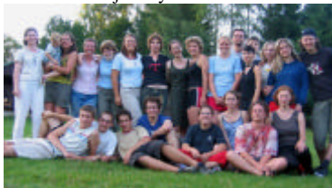
závěrečné foto účastníků