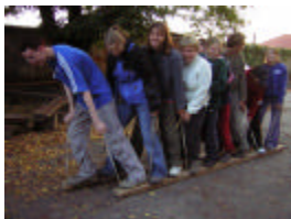
PL 1 - Fryšták