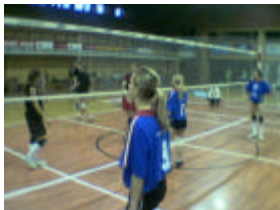
turnaj v C.Budejovicích