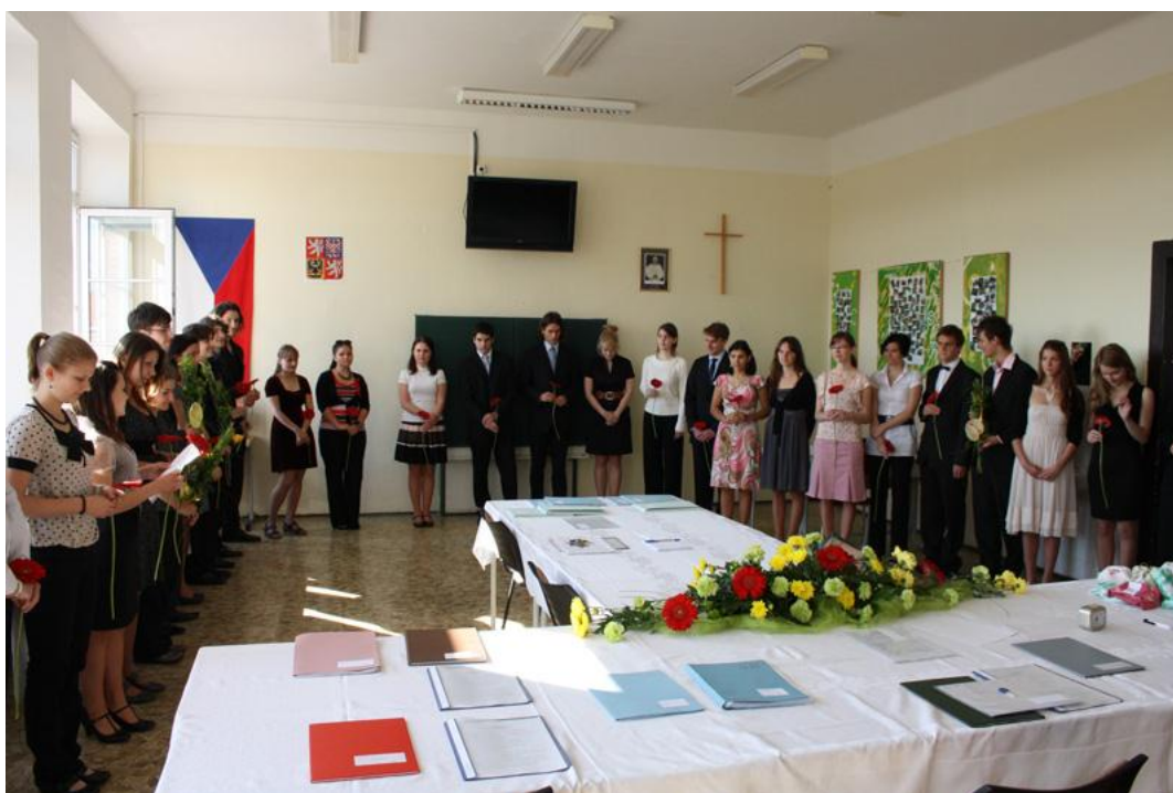
Zahájení maturit na gymnáziu - jaro 2011