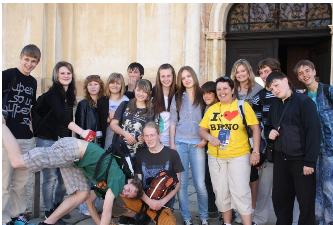
Přátelé z Ukrajiny v Brně