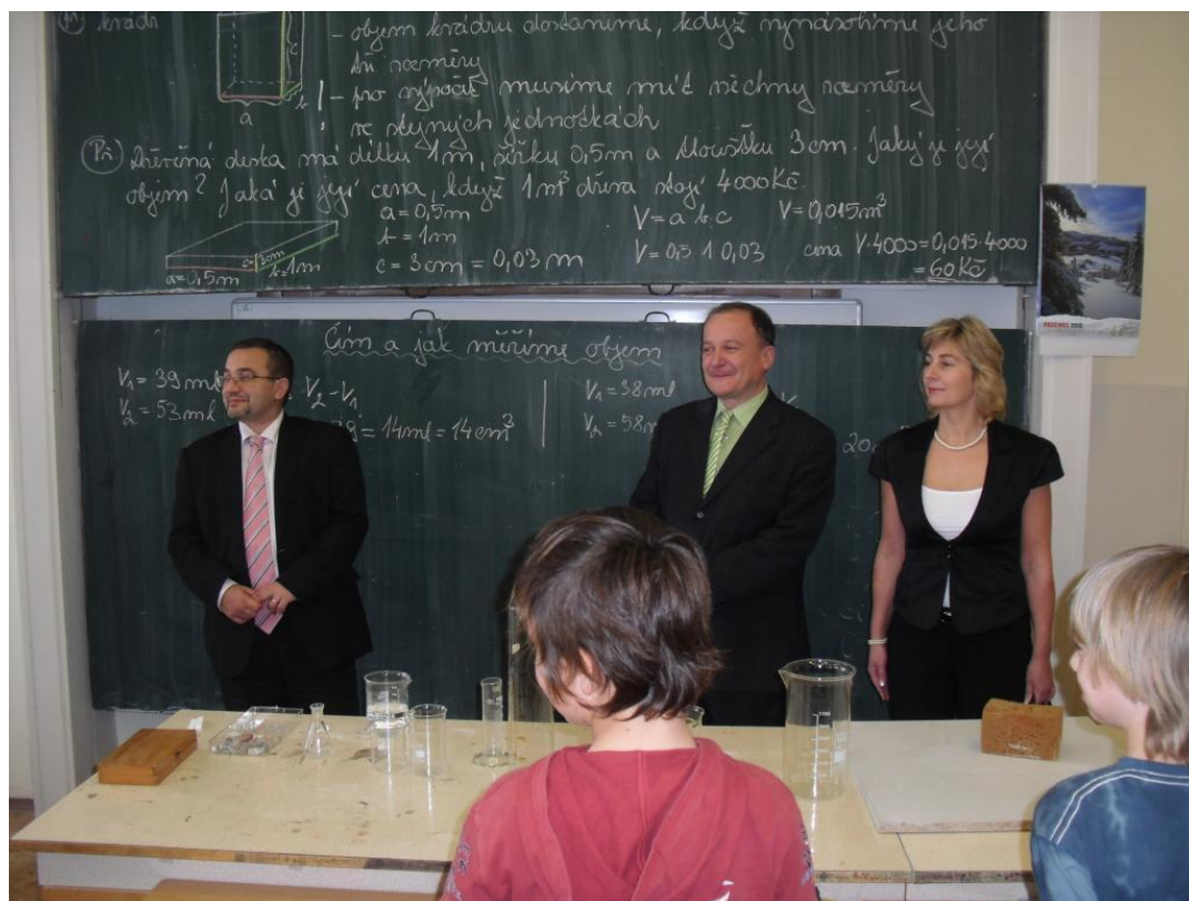
Pan ministr zkouší primány gymnázia z fyziky