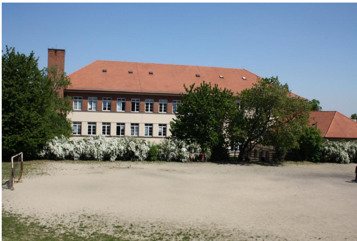
Místo pro stavbu tělocvičny a hřišť v areálu školy

účely. Se snižujícím se počtem uchazečů na střední školy budeme rozvíjet propagaci školy na veřejnosti, tedy tisk letáčků, inzeráty v médiích, burzy a veletrhy škol, dny otevřených dveří.